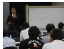
昨年のセミナーの様子