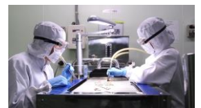
JIHFS GMP 認定工場の 品質管理の様子 (株)エフアイコーポレイション